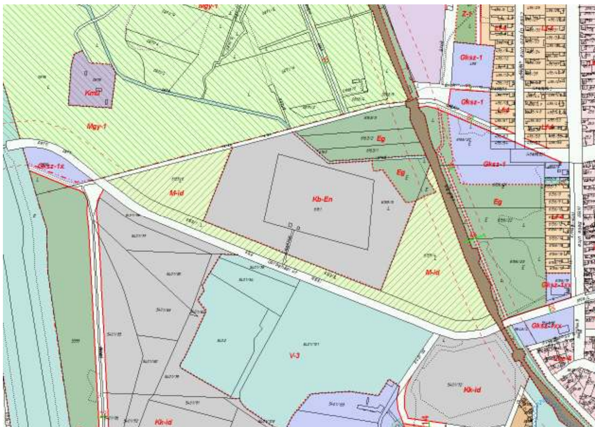
A szabályozási terv tervezett módosítása

Az Étv. 30/A. § (1) bekezdés értelmében az önkormányzat településrendezési szerződést kíván kötni a kérelmezőkkel, a településrendezési eszközök módosítását eredményező tervezési díj rájuk eső költségterhek áthárításával, melyet a kérelmezők vállalnak megtéríteni.