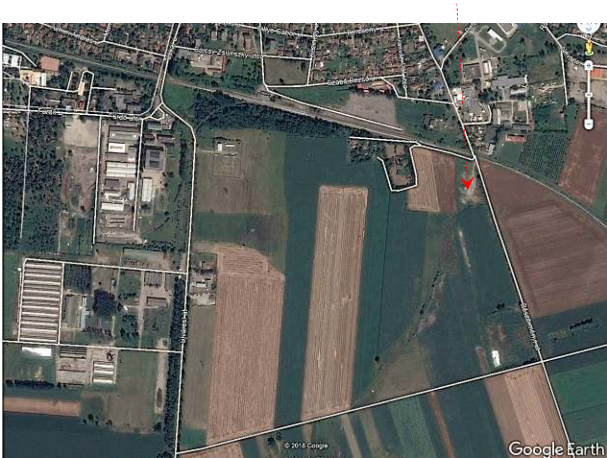
Légi fotó a módosítással érintett területegről

A szabályozási terv módosításának célja, a hatályos szabályozási tervben ipari gazdasági (Gip – jelű) építési övezet észak-keleti szélén, részben közlekedési és védőerdő övezetbe sorolt, kérelemmel érintett hrsz.-ú ingatlanrészek átsorolása „Gip”-jelű építési övezetbe, annak érdekében, hogy az ingatlan teljes területén napelemes erőművet lehessen kialakítani.