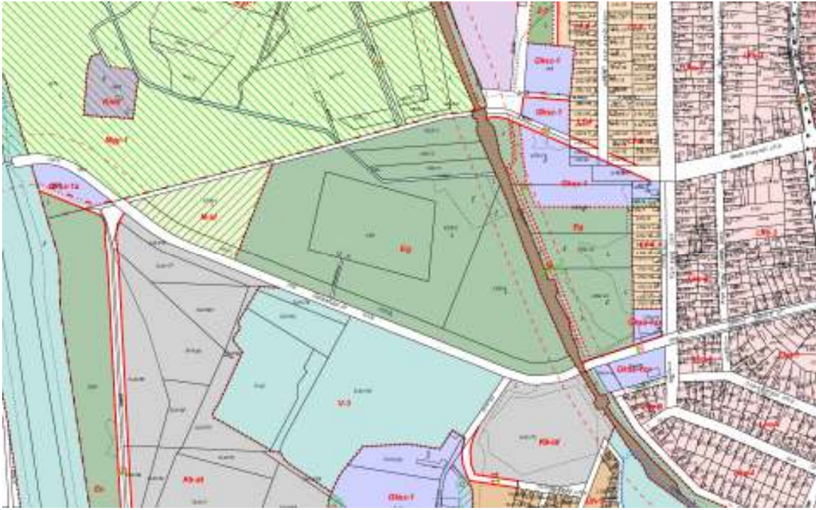
A hatályos szabályozási terv részlete.

A beruházó által kezdeményezett, 6159/5 hrsz.-ú földterületet érintő módosítás során, az érintett teljes tervezési tömb területfelhasználását és szabályozását érdemes most átgondolni. A 6159/5 hrsz.-ú ingatlan által körülhatárolt 6161 hrsz.-ú önkormányzati tulajdonban lévő, rekultivált egykori szemétkerakó területe jelenleg funkció nélküli. Az önkormányzatnak szándékában áll területet szintén napelempark számára bérbe adni. Emiatt a szabályozás tervezete, mindkét területet „Kb-En” –jelű, megújuló energiaforrás hasznosítására szolgáló, beépítésre nem szánt különleges övezetbe sorolja át.