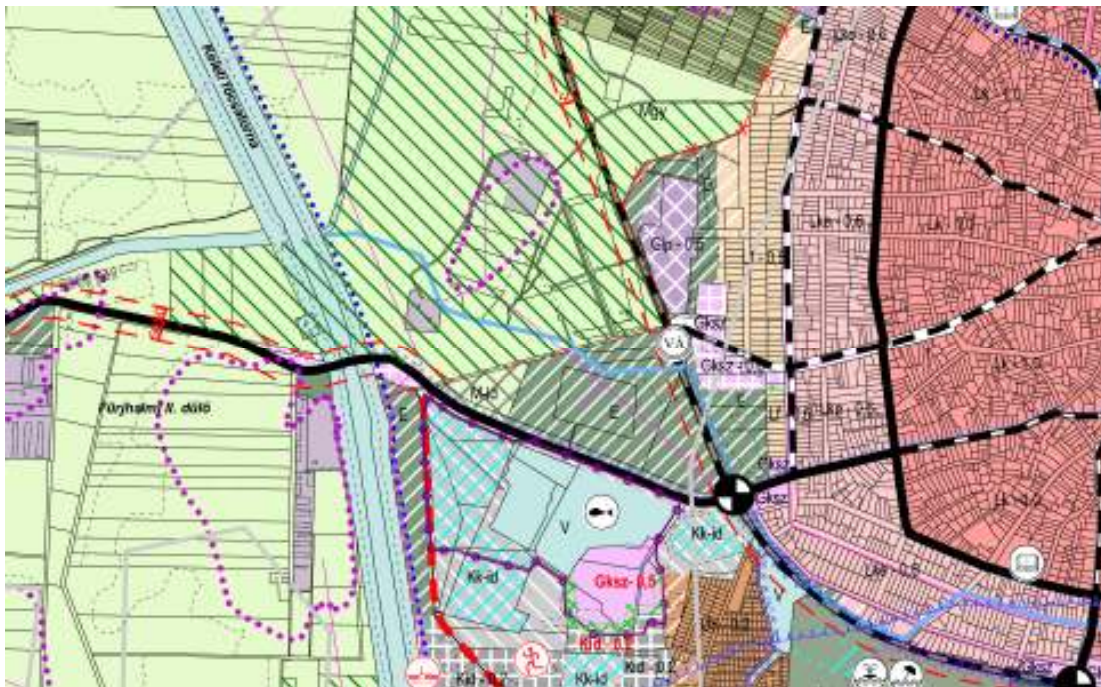
A hatályos településszerkezeti terv részlete

A hatályos településszerkezeti terv a Görbeházi út- Natura 2000 védettségű terület és a Debrecen - Tiszaalpök vasútvonal által határolt, jelenleg többségében legelőterületeket, erdő felhasználásba sorolja. A hatályos településszerkezeti tervben előirányzott módosítás, a rekreációs és idegenforgalmi hasznosításra tervezett, volt téglagyári tavakkal szembeni (Görbeházi út túlsó oldalán elhelyezkedő) területet a település klíma, és a rekreációs terület környezetének javítása érdekében tervezte erdősítésre