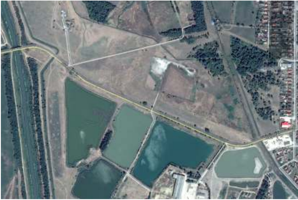
Légi fotó, a területről és környezetéről.

A hatályos településszerkezeti terv a Görbeházi út- Natura 2000 védettségű terület és a Debrecen - Tiszaalpök vasútvonal által határolt, jelenleg többségében legelőterületeket, erdő felhasználásba sorolja. A hatályos településszerkezeti tervben előirányzott módosítás, a rekreációs és idegenforgalmi hasznosításra tervezett, volt téglagyári tavakkal szembeni (Görbeházi út túlsó oldalán elhelyezkedő) területet a település klíma, és a rekreációs terület környezetének javítása érdekében tervezte erdősítésre