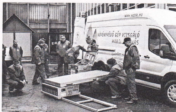
A kontrolláló rendszer egyik nagy előnye a mobilitás

Felülvizsgálják a több mint hároméves permetezőgépek műszaki állapotát. Az országban hamarosan huszonnégy mobil alállomás működik majd, és akár a gazda telephelyén is elvégezhetik a vizsgálatot. A gazdáknak december 14-ig meg kell rendelniük az ellenőrzést.